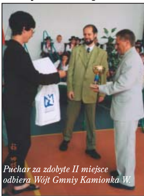
Puchar za zdobyte II miejsce odbiera Wójt Gminy Kamionka W.

W ciągu całego roku przeprowadzone były imprezy sportowo rekreacyjne ujęte w gminnym kalendarzu imprez. Między innymi zorganizowano: marzec - Gminny Turniej Szachowy, kwiecień - Gminny Turniej Piłki Siatkowej Drużyn Mieszanych i Gminny Turniej Tenisa Stołowego, maj - X Gminne Igrzyska Młodzieży Szkolnej z okazji Dnia Dziecka i Ogólnopolski Sportowy Turniej Miast i Gmin, czerwiec - lipiec - Gminny Turniej Piłki Nożnej o Puchar Wójta, październik - Gminny Turniej Piłki Siatkowej Kobiet o Puchar Przewodniczącego Rady Gminy, grudzień - Gminny Turniej Piłki Siatkowej Mężczyzn o Puchar Skarbnika Gminy. Do najbardziej masowej imprezy zaliczyć należy Ogólnopolski Sportowy Turniej Miast i Gmin, którego podsumowanie odbyło się w dniu 10 września 2002 roku w Starym Sączu. Podczas uroczystości wręczone zostały pamiątkowe puchary, statuetki i dyplomy dla gmin za uzyskane efekty w ogólnej punktacji na tere-