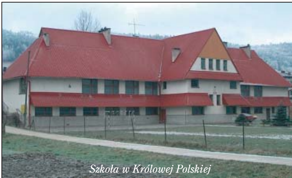
Szkoła w Królowej Polskiej

dagogiczne liczy 11 osób, 64% ogółu nauczycieli legitymuje się wykształceniem wyższym magisterskim, a 75% kadry posiada kwalifikacje do nauczania drugiego przedmiotu. W oparciu o programy nauczania dobrane odpowiednio do możliwości percepcyjnych ucznia oraz cie-