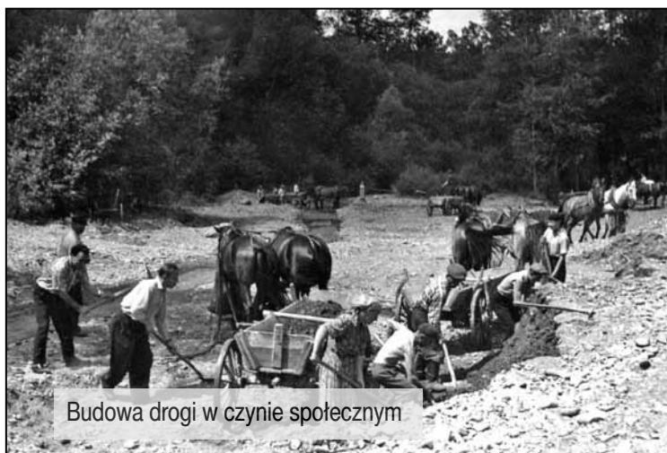
Budowa drogi w czynie społecznym