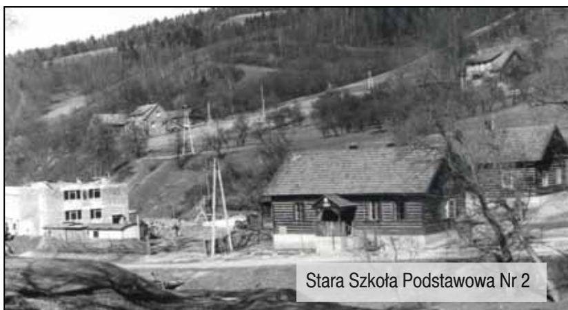
Stara Szkoła Podstawowa Nr 2