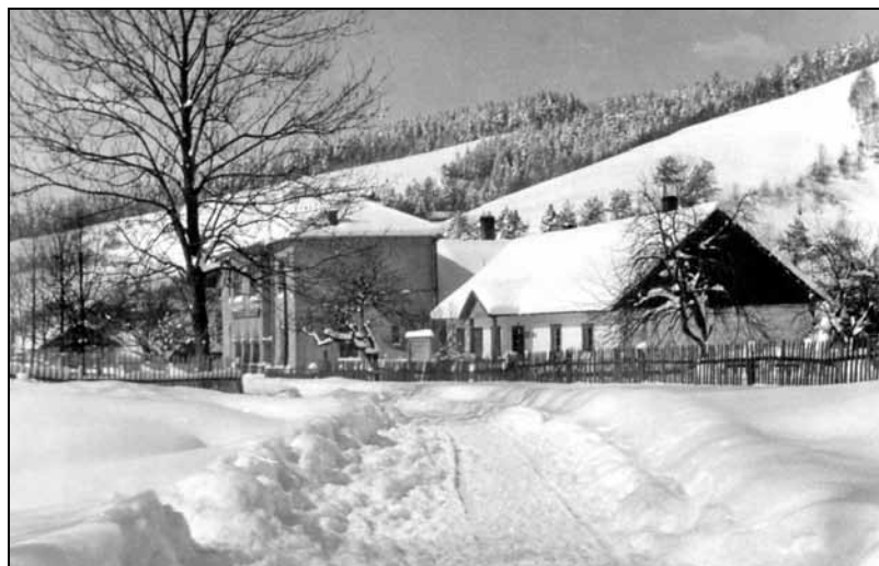
Na pierwszym planie drewniany budynek Urzędu Gminy