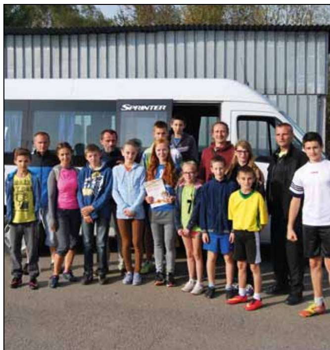
MP Fot. autora