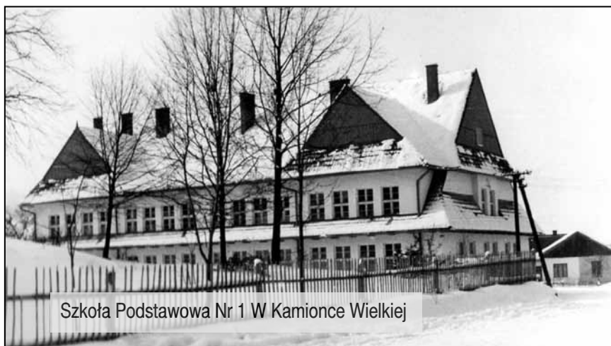
Szkoła Podstawowa Nr 1 W Kamionce Wielkiej